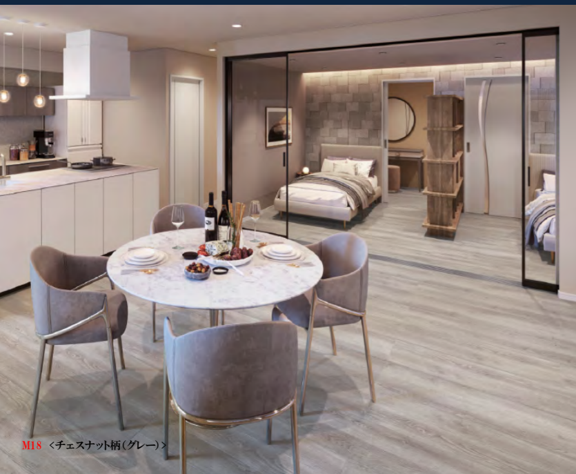
M18 <チェスナット柄(グレー)>