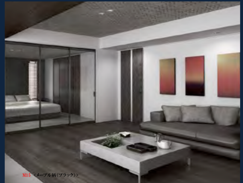
M15 <メープル柄(ブラック)>