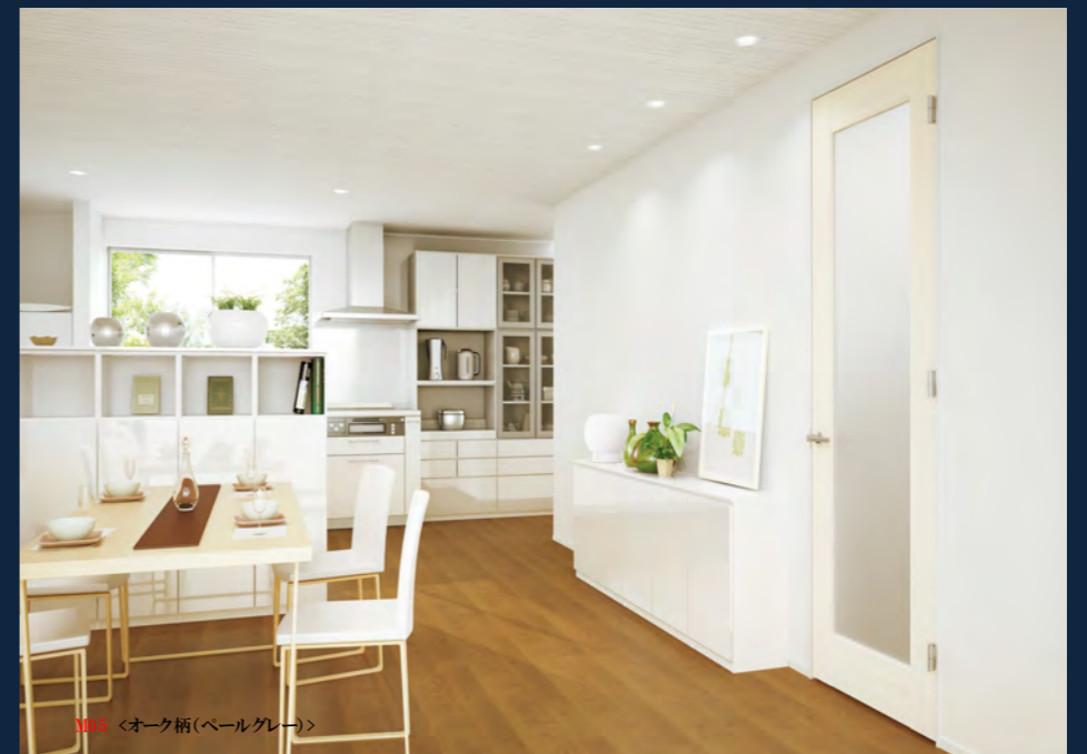
M03 <オーク柄(パールグレー)>