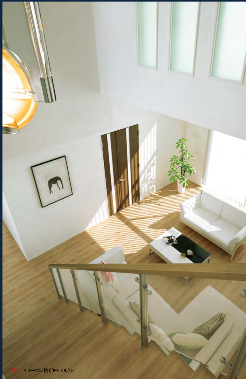
M04 <メープル柄(キャメル)>