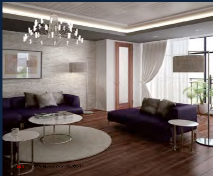
M14 <アッシュ柄(レティッシュブラウン)>